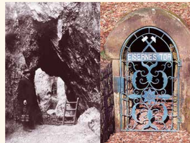
„Eisernes Tor“ - Wahrzeichen des Eisenerzbergbaus

Über einen Schacht mit Wendeltreppe gelangt man zum rund 15 Meter höher liegenden Stollen der oberen Sohle, der in seinem Verlauf enge Stollen aus dem 18. Jahrhundert quert.