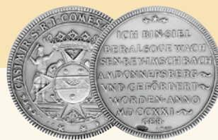
Silbteraler aus Imsbach aus dem Jahre 1721

Bergbauspuren aus den letzten 600 Jahren begegnen dem Besucher bei einem Rundgang durch das ausgedehnte Stollensystem des Besucherbergwerks „Weiße Grube“: Von sauber mit Schlägel und Eisen bearbeiteten Bereichen aus dem Mittelalter bis hin zu den mit Sprengstoff herausgeschossenen Grubenbauen der letzten Bergbauphase zu Beginn des 20. Jahrhunderts. Kupfer-, Silber- und Kobalterz wurde hier in mühsamer Arbeit ans Tageslicht gebracht. In den großen unter- und überirdischen Abbauweiten lassen in allen Farben leuchtende Minerale den einstigen Erzreichtum der Grube erahnen. Übertage werden Techniken zur Aufbereitung der Erze gezeigt.