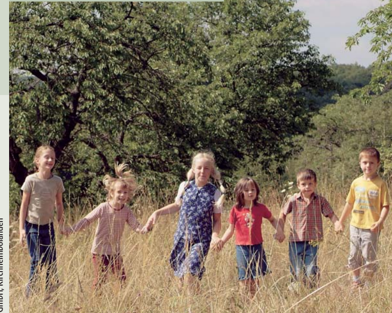
Druck: GTS-Druck GmbH, Kirchheimbolanden